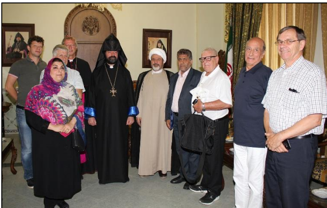
Նոյն օրը Ազգային առաջնորդարանը հիւրընկալեց Կրօնների եւ դաւանանքների համալսարանի միջոցով կազմակերպւած համաժողովի մասնակիցներին:

Երկու հանդիպումների ընթացքում, ծանօթութեան գծով տեղեկութիւններ փոխանցեցին կողմերի միջեւ, եղան հարց եւ պատասխաններ: Այնուհետեւ արծարծեցին տարբեր խնդիրներ, որոնք հիմնականում վերաբերում էին Իրանի հայկական համայնքների եւ տեղի իշխանութեան միջեւ առկայ յարաբերութեանը եւ որպէս կրօնական փոքրամասնութիւն՝ հայութեանը վերապահւած իրաւունքներին, որոնց տրեց համապարփակ բացատրութիւն: