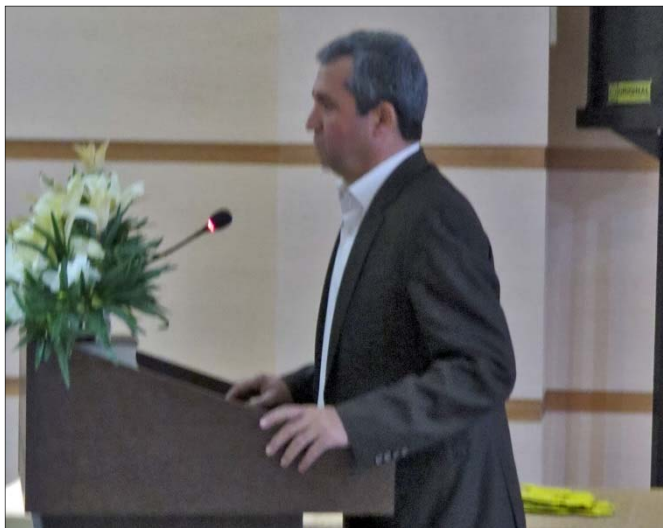
Ընդմիջումից յետոյ, նախքան եզրափակիչ փուլի

Բաւականին թէժ ու հաճելի մրցակցութիւն ընթացաւ մասնակից եօթ խմբերի միջեւ եւ արդիւնքների ամփոփումից յետոյ Հայաստան ու Ադանա խմբերը յաջողեցին անցնել եզրափակիչ փուլ: