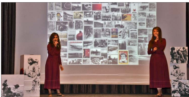
Այնուհետեւ տեղի ունեցաւ մրցութի մասնակիցների