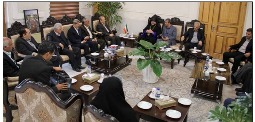
Բարեմաղթանքներ փոխանցելուց եւ հիւրասիրելուց յետոյ պատիրակութիւնը հրաժեշտ տուց նահանգապետին:

նորդ Սրբազան Հօր «Արքութեան» տիտղոսի ստացման առիթներով: Պրն. նահանգապետն անցնող տարւայ մեծ ձեռքբերումներից համարեց Ս. Ամենափրկչեան վանքի «Ս. Յովսէփ Արեմաթացի» եկեղեցու 350-ամեակի պատշաճ տօնակատարութիւնը, Ն.Ս.Օ.Տ.Տ. Արամ Ա Վեհափառ Հայրապետի հովակալան եւ Հայաստանի հանրապետութեան վարչապետի աշխատանքային այցը Սպահան: Յիշեալն իր խօսքերի մէջ յատուկ կերպով շեշտեց, որ աշխարհը պէտք է իմանայ, որ ընդհանրապէս Իրանում եւ ի մասնաւորի Սպահանում միաստանաձեւ կրօնների հետեւորդները խաղաղ համագոյակցութեամբ եւ միասնական ջանքերով ստեղծել են օրինակելի մի միջավայր, որը յատկապէս գարնանային այս օրերին, առաւել հաճելի է դարձել այցելուների եւ զբօսաշրջիկների համար: